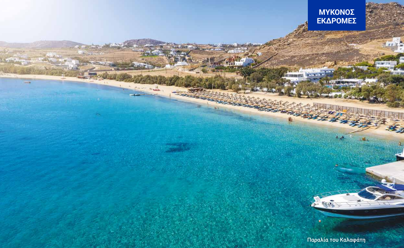
Παραλία του Καλαφάτη