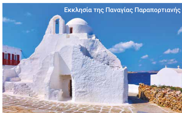
Εκκλησία της Παναγίας Παραπορτιανής