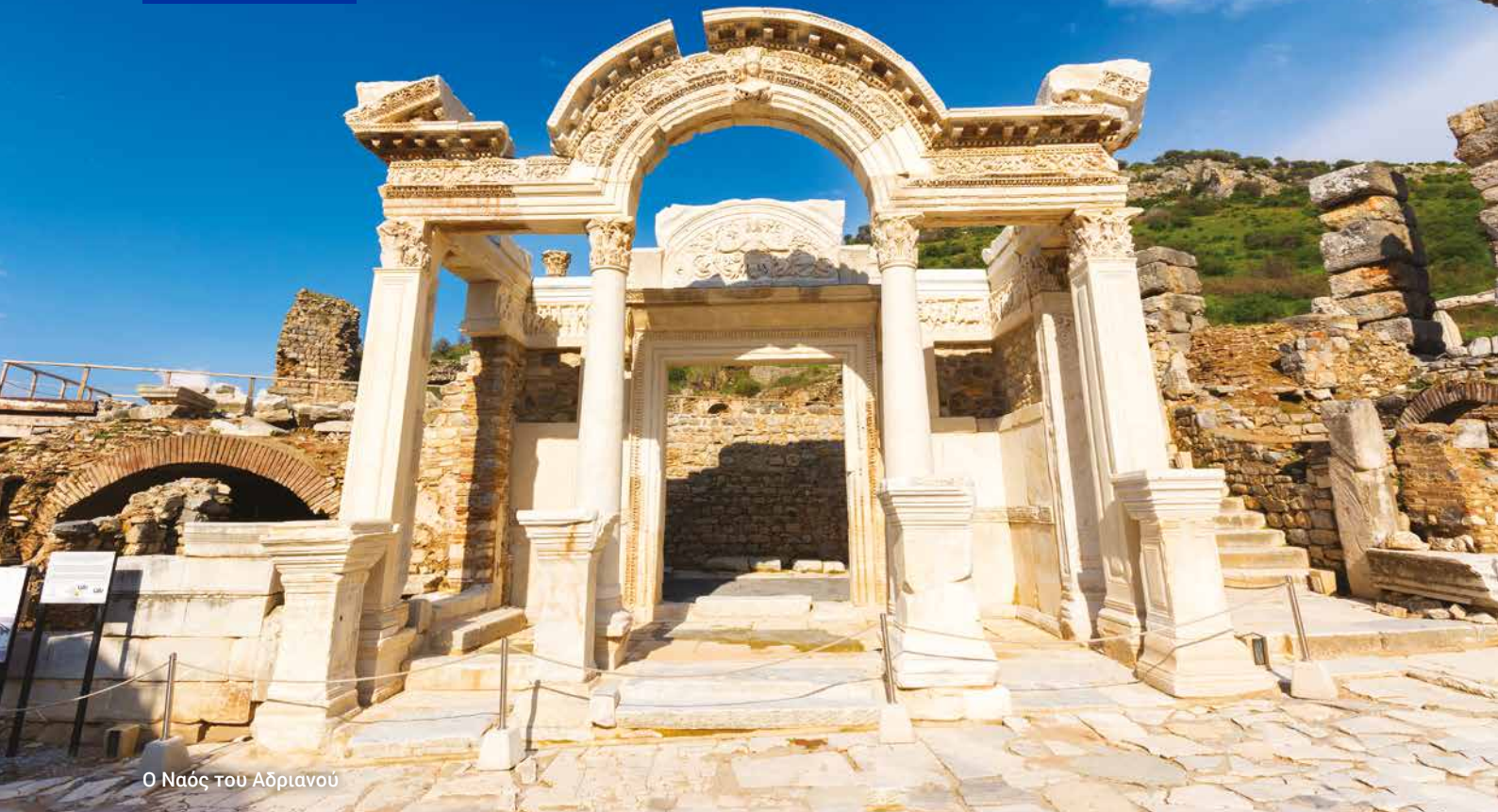
Ο Ναός του Αδριανού