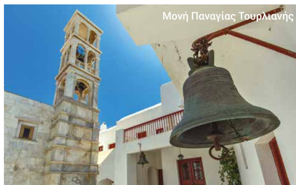
Μονή Παναγίας Τουρλιανής

Η ξενάγηση ενδέχεται να μην είναι διαθέσιμη ορισμένες περιόδους του χρόνου.