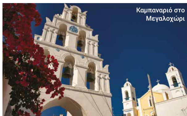
Καμπαριό στο Μεγαλοχώρι