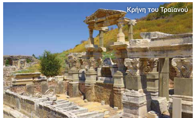
Κρήνη του Τραϊανού

Στο τέλος της ξενάγησής μας έχουμε χρόνο και για λίγο ...shopping. Επιλέξτε χαλιά, κοσμήματα, δερμάτινα είδη και αναμνηστικά.