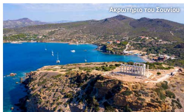
Ακρωτήριο του Σουνίου

Ο αρχαιολογικός χώρος του Σουνίου, εκτός από τα Ιερά του Ποσειδώνα και της Αθηνάς, περιλαμβάνει το φρούριο, έναν μικρό οικισμό της ελληνοιστικής εποχής, τα προπύλαια και τις στοές.