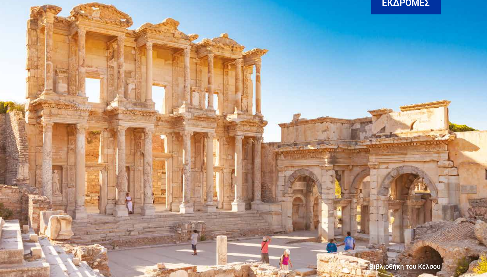
Βιβλιοθήκη του Κέλλσου