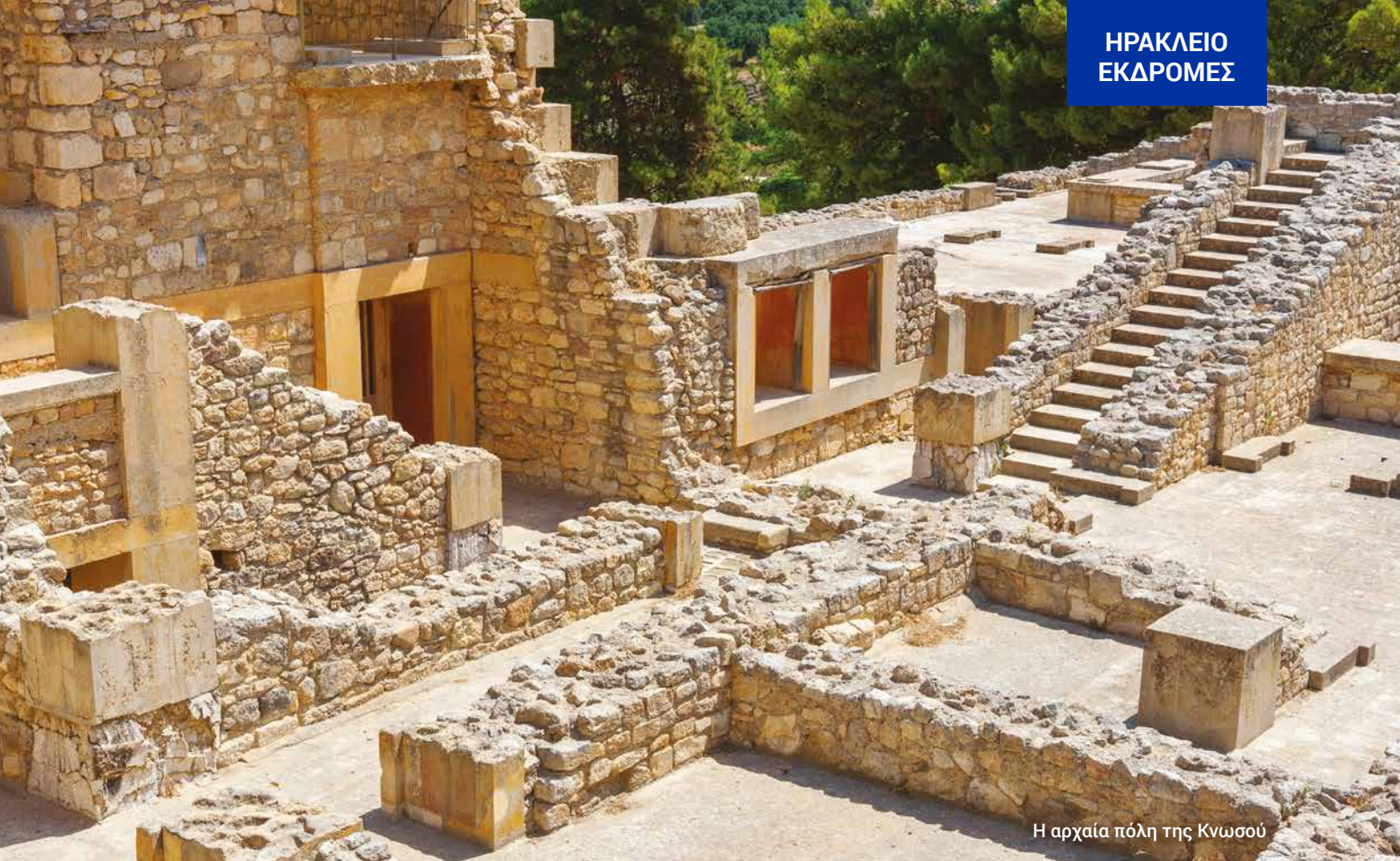
Η αρχαία πόλη της Κνωσού