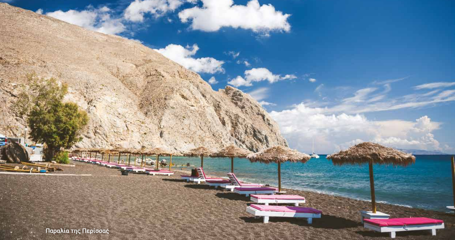
Παραλία της Περίσσας