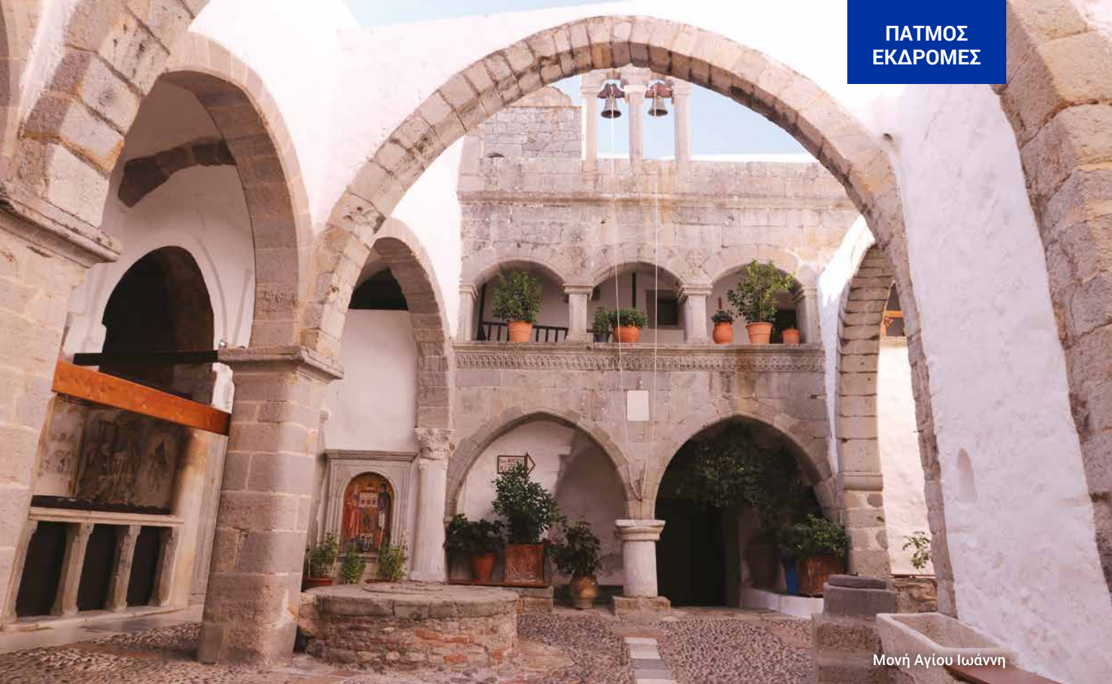
Μονή Αγίου Ιωάννη