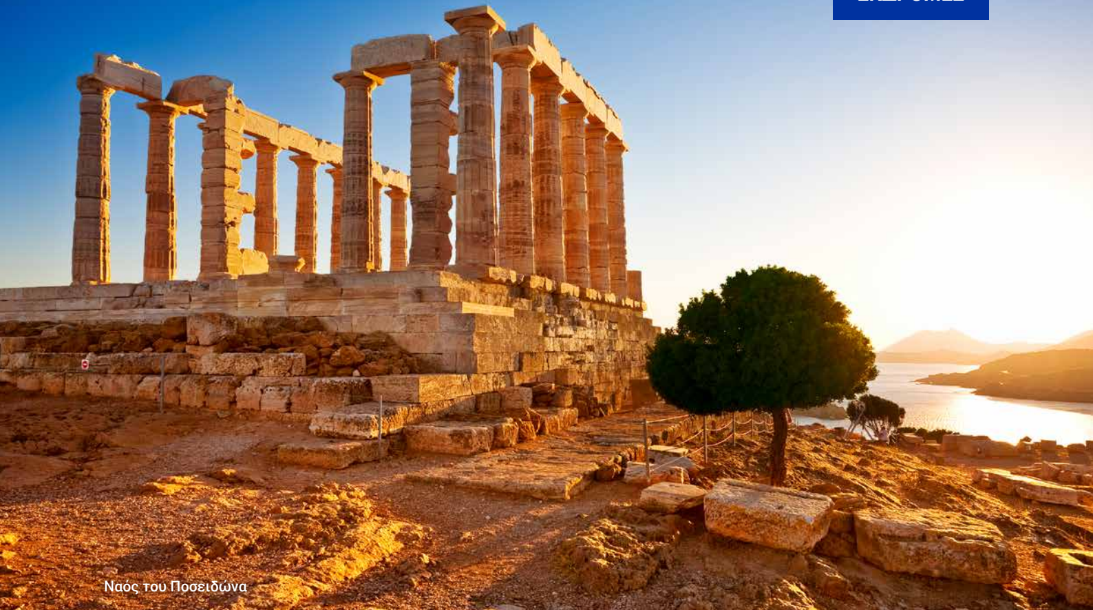
Ναός του Ποσειδώνα