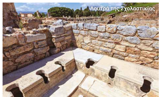
Λουτρά της Σχολαστικής