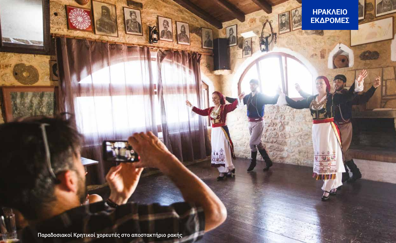
Παραδοσιακοί Κρητικοί χορευτές στο αποστακτήριο ρακής