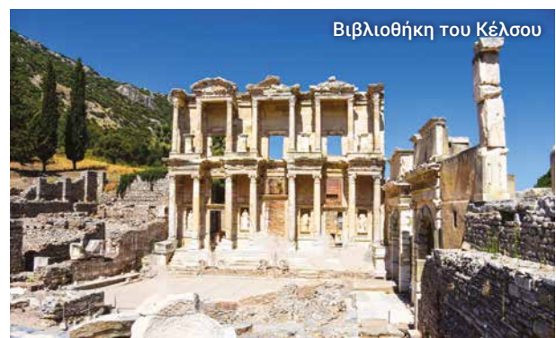
Βιβλιοθήκη του Κέλσου

Στο τέλος της ξενάγησής μας έχουμε χρόνο και για λίγο ...shopping. Επιλέξτε χαλιά, κοσμήματα, δερμάτινα είδη και αναμνηστικά.