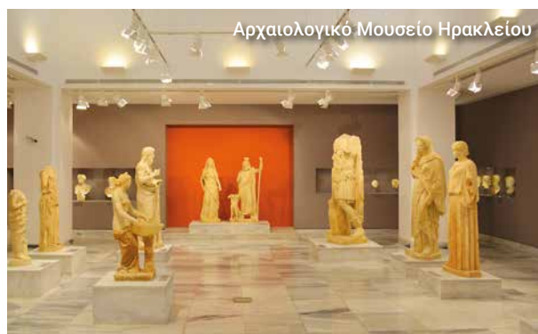
Αρχαιολογικό Μουσείο Ηρακλείου

Στο τέλος, επισκεπτόμαστε το Αρχαιολογικό Μουσείο Ηρακλείου για να μάθουμε περισσότερα για την ιστορία και τον πολιτισμό της Κρήτης.