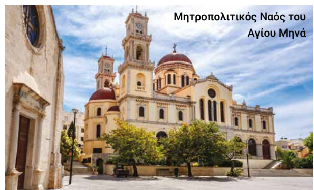
Μητροπολιτικός Ναός του Αγίου Μηνά

Επιστρέφουμε στο ιστορικό Ηράκλειο που ιδρύθηκε το 824 και μαθαίνουμε για μερικές από τις σημαντικότερες ιστορικές μορφές και τα υπέροχα αξιοθέατά του, όπως το φρούριο «Κούλες», η ενετική Λότζια, η Βασιλική του Αγίου Μάρκου, το μεσαιωνικό μοναστήρι της Αγίας Αικατερίνης και ο Μητροπολιτικός Ναός του Αγίου Μηνά.