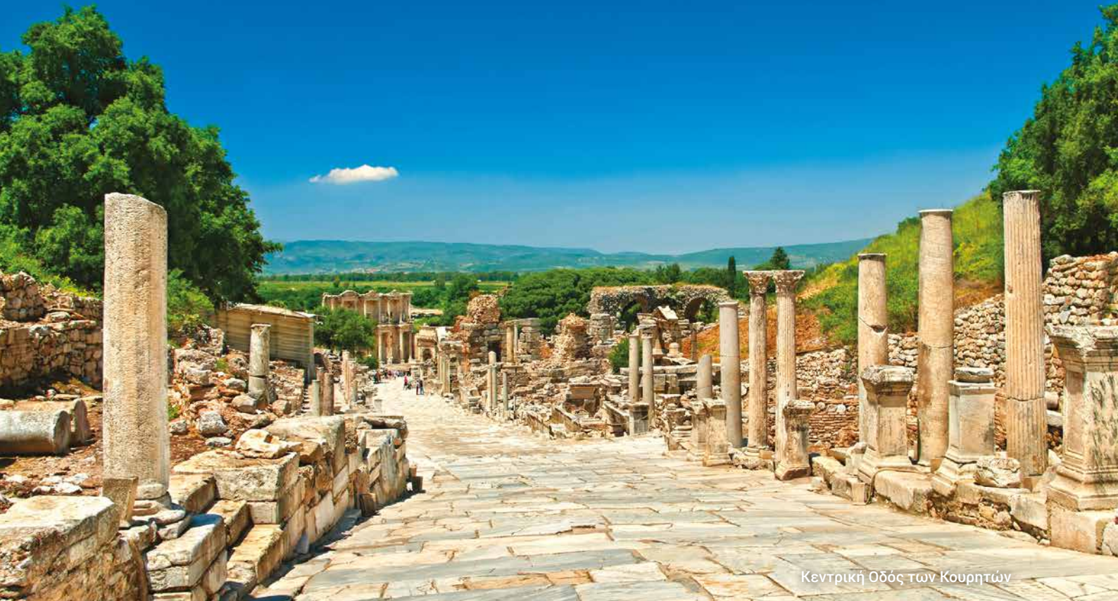
Κεντρική Οδός των Κουρητών