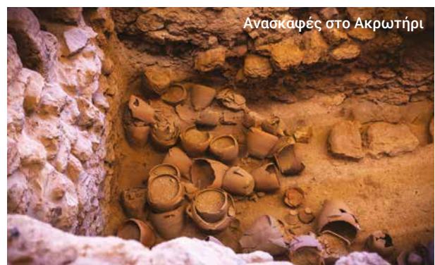
Ανασκαφές στο Ακρωτήρι

Η ξενάγηση ενδέχεται να μην είναι διαθέσιμη ορισμένες περιόδους του χρόνου.