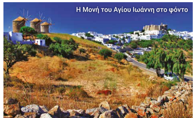
Η Μονή του Αγίου Ιωάννη στο φόντο

Στο ατμοσφαιρικό καφέ Αγίον σας περιμένει καφές και άλλα αναψυκτικά.