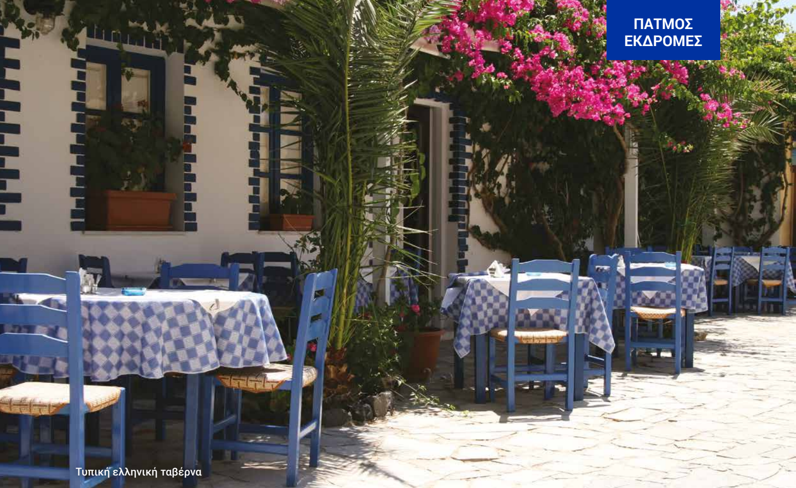
Τυπική ελληνική ταβέρνα