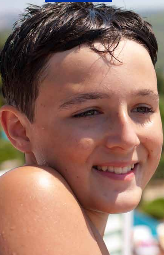
Adaland Water Park