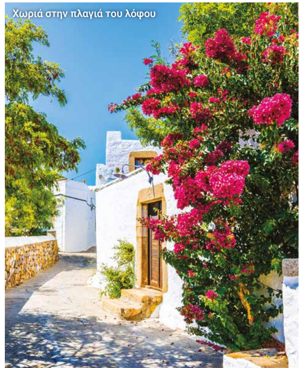
Χωριά στην πλαγιά του λόφου

Ζούμε την εμπειρία του αυθεντικού τρόπου ζωής στην καρδιά της υπαίθρου στην Πάτμο.