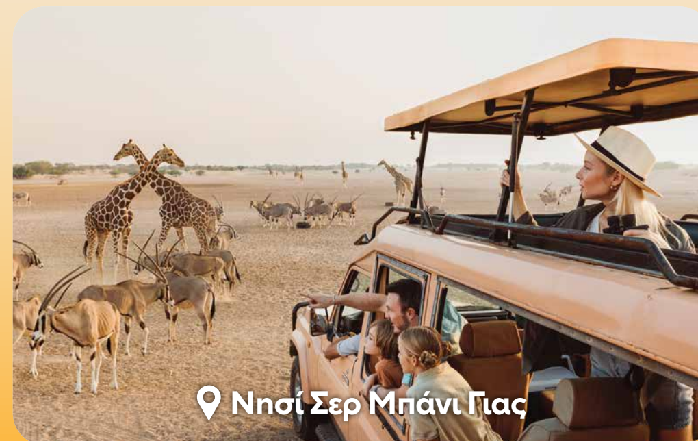
📍 Νησί Σερ Μπάνι Γιας