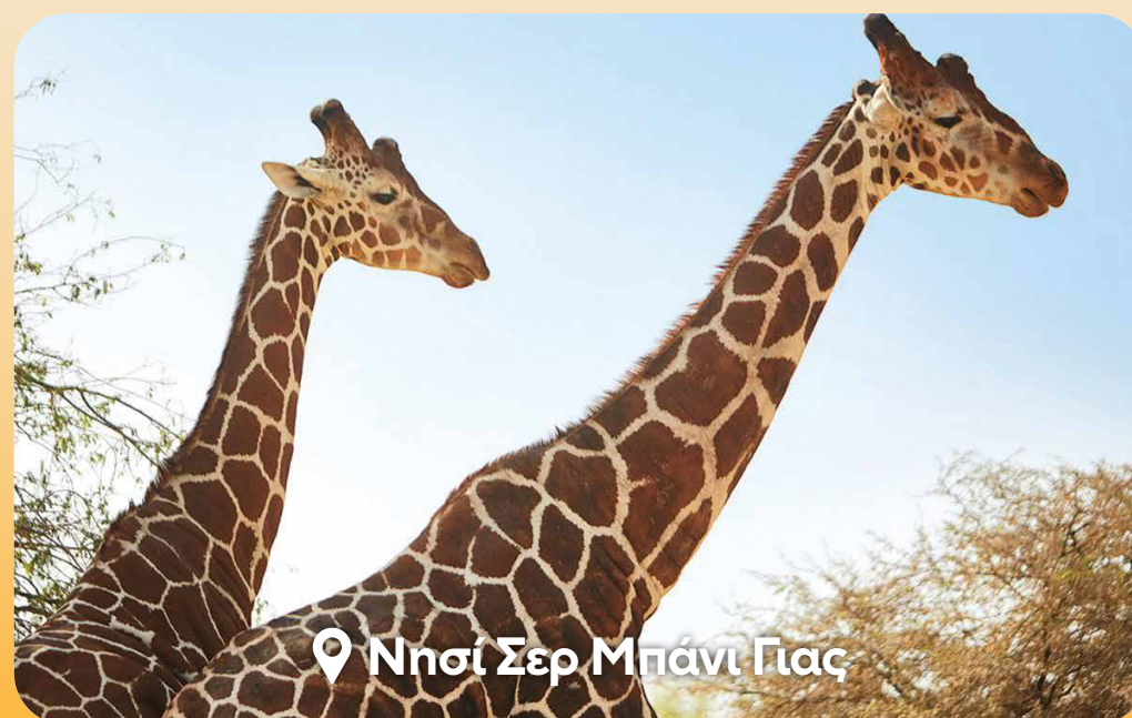
📍 Νησί Σερ Μπάνι Γιας