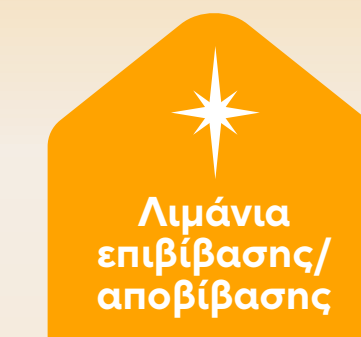
Λιμάνια επιβίβασης/ αποβίβασης