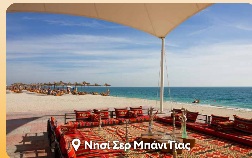
📍 Νησί Σερ Μπάνι Γιας