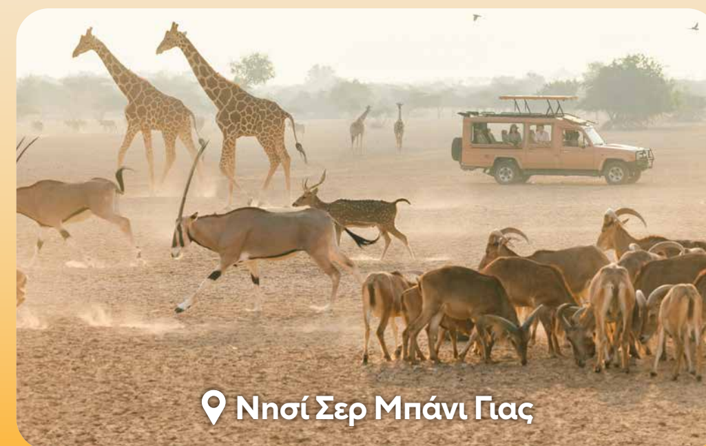
Νησί Σερ Μπάνι Γιας